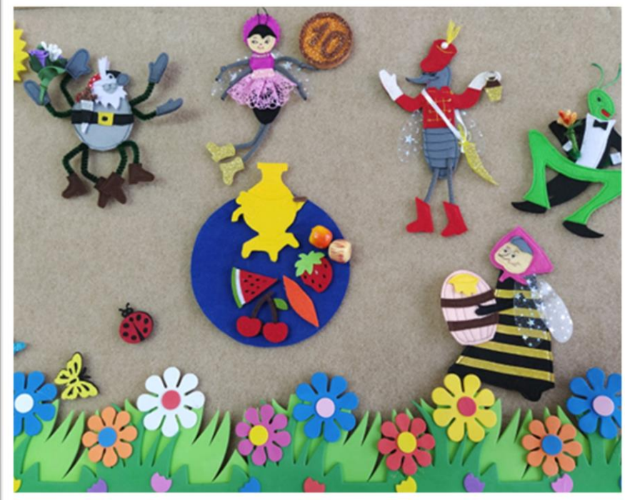
«МУХА – ЦОКОТУХА»